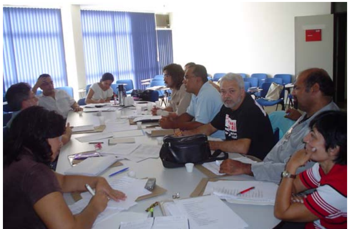
Comissão da 3ª CNST

Também será formada uma Coordenação de Relatoria, formada por um relator e um relator-adjunto.